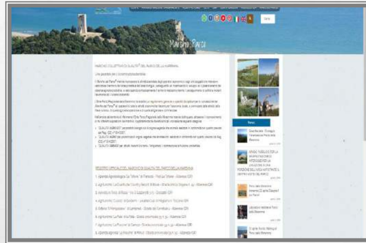
SITO ISTITUZIONALE DELL'ENTE PARCO MARCHIO DI QUALITÀ