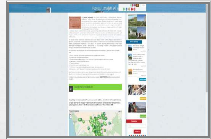
SITO ISTITUZIONALE DELL'ENTE PARCO ESERCIZI CONSIGLIATI